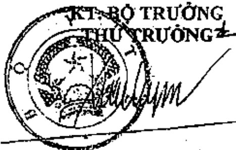
Đỗ Xuân Tuyên